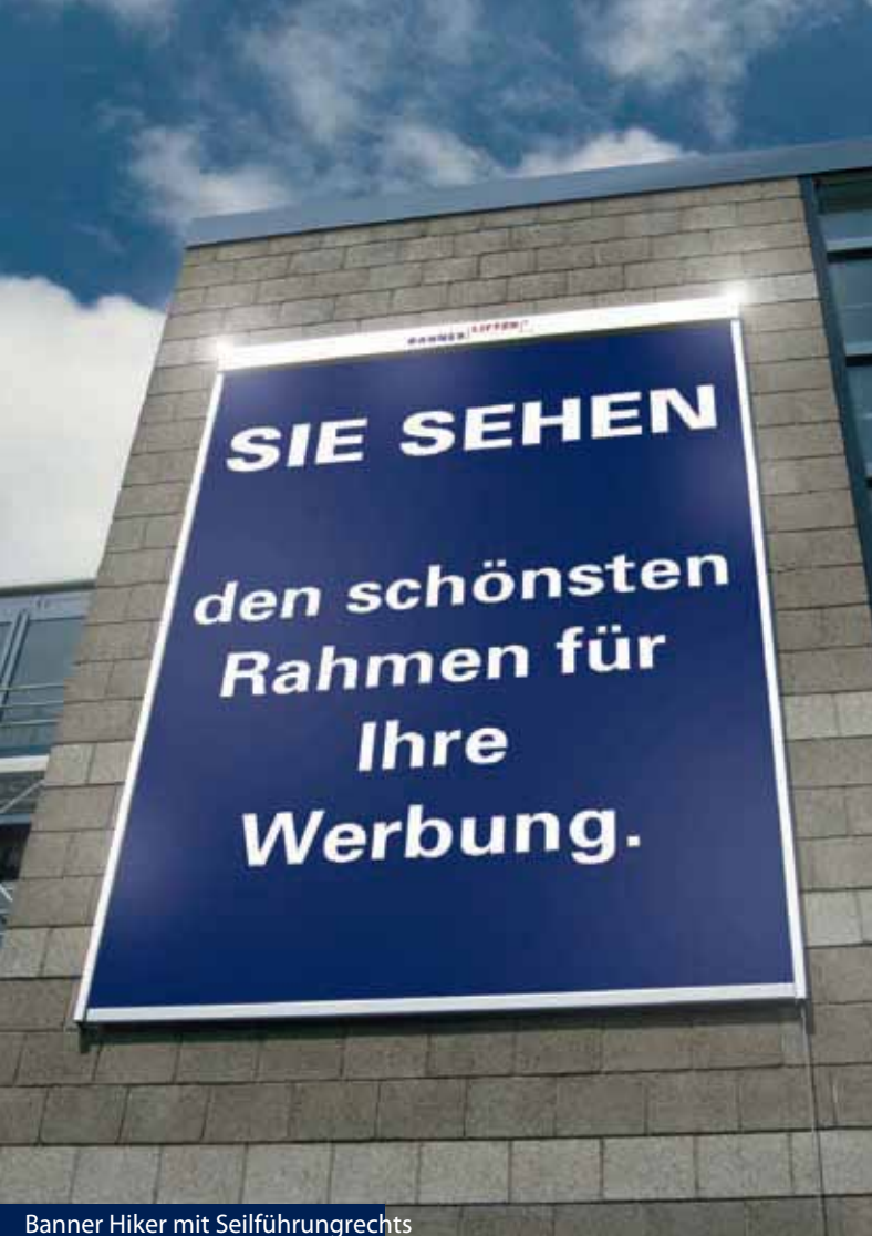
Banner Hiker mit Seilführungsrechts